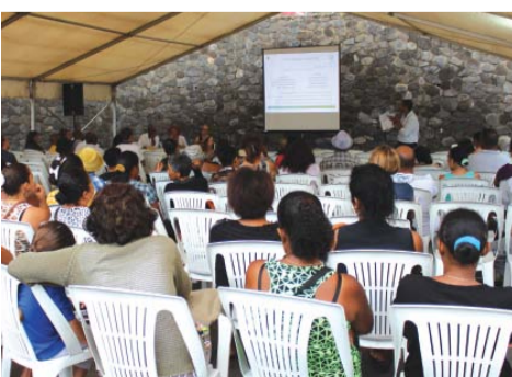
ZINFO NOUT PROJET L'actu sur le projet