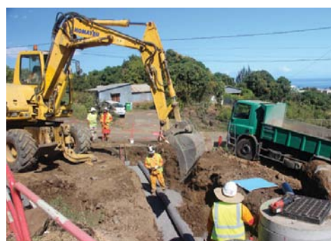
ZINFO TRAVAUX Infos pratiques