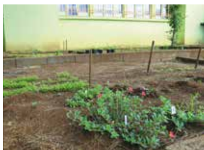
Les enfants s'initient au jardinage dans la cour de l'école.

L'approche environnementale du projet est cette année le sujet privilégié. Ainsi, la classe de CE2/CM1 aborde le logement ; une classe de CM2 réfléchit à l'habitat et la place des personnes âgées dans Sans Souci ; une classe de CE2 travaille sur la protection des arbres remarquables ; enfin deux classes, une de CP et une de CE1, vont activement participer avec l'aide d'une habitante à la création d'une pépinière sur le terrain en face de l'école.